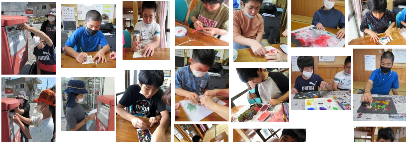
残暑お見舞い、書いたよ。