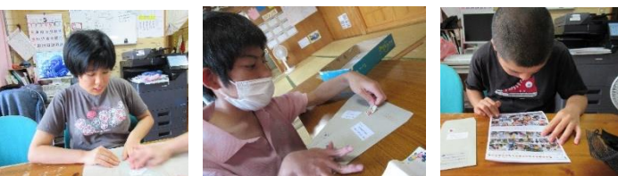
『ひまわりだより』封入・封緘作業