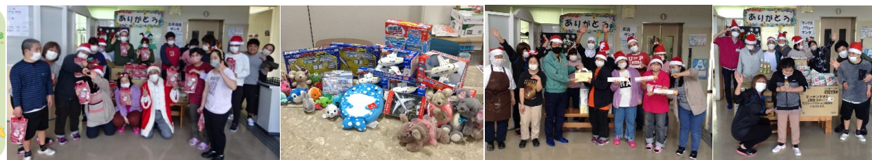
忠孝酒造株式会社様 エアポートトレーディング株式会社様 株式会社名城様 マックスバリュ豊見城店様